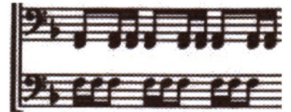
譜例3 第1・3楽章より

第1楽章 ：弦楽オーケストラがさざ波のように静謐に揺らめく中、湖面を音もなく滑る冥府の白鳥のように独奏ヴァイオリンが優美に悲しく歌う。そのたおやかな流れを断ち切るように、オーケストラが鋭いリズム（ 譜例4 ）を打ち込む。すると音楽は急激に劇性を強め、静かに轟くような伴奏リズム（ 譜例3 ）に乗って独奏ヴァイオリンが扇情的に盛り上げる。その後も、どこか懐かしさを感じさせる木管の歌、高みから森を見渡すような広がりをもった独奏ヴァイオリンの旋律など、多様な要素が盛り込まれ、それらがソナタ形式に則って再現される。独奏ヴァイオリンの長大なソロは提示部・再現部のそれぞれに置かれる。提示部のソロは黄昏の空のような妖気に満ちているのに対し、再現部のソロはバッハの受難曲のような厳粛とした悲歌である。楽章の最後は、弦楽オーケストラが 譜例4 のリズムを連呼する上を、独奏ヴァイオリンがフルートを伴って激しく飛翔する。