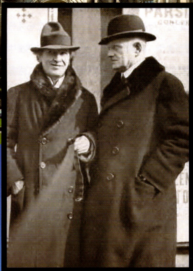
1921年、旧交を温めるブゾーニとシベリウス