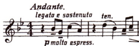
譜例8 エニグマ変奏曲・テーマ

変奏曲とは、曲の冒頭でテーマが示され、そのテーマを少し変化させた曲を次々と歌い継いでいく音楽の形式である。本日演奏する「エニグマ」変奏曲の場合は、テーマは 譜例8 のように始まる。そして、第1変奏では 譜例9 、第2変奏では 譜例10 、第3変奏では 譜例11 といった要素が聞かれ、これらがテーマ( 譜例8 )を少し変化させたものであることが容易に分かる。このような変奏が、実に第14変奏までなされる。